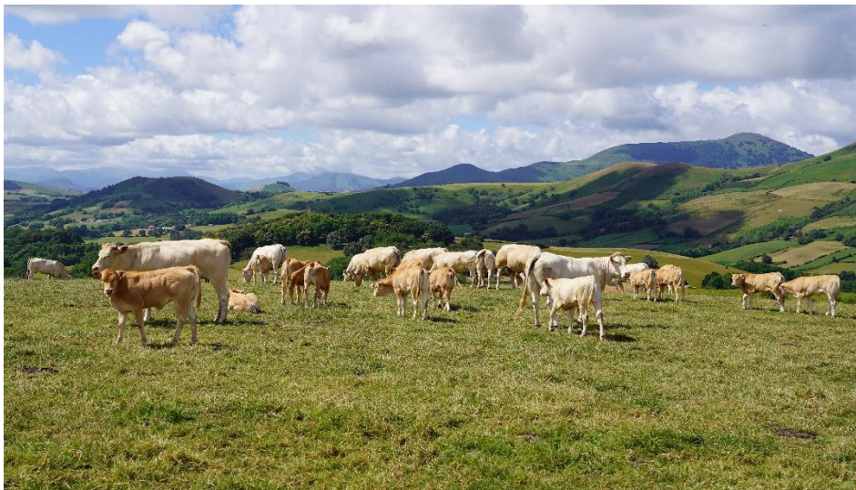
Race Blonde d'Aquitaine

Les actions engagées au cours du dernier exercice ont consolidé la valorisation de toutes les catégories de bovins (boucherie, maigre, veaux) par la diversification des débouchés, la sécurisation des ateliers d'engraissement, le renforcement des partenariats et une meilleure maîtrise des coûts logistiques et techniques.