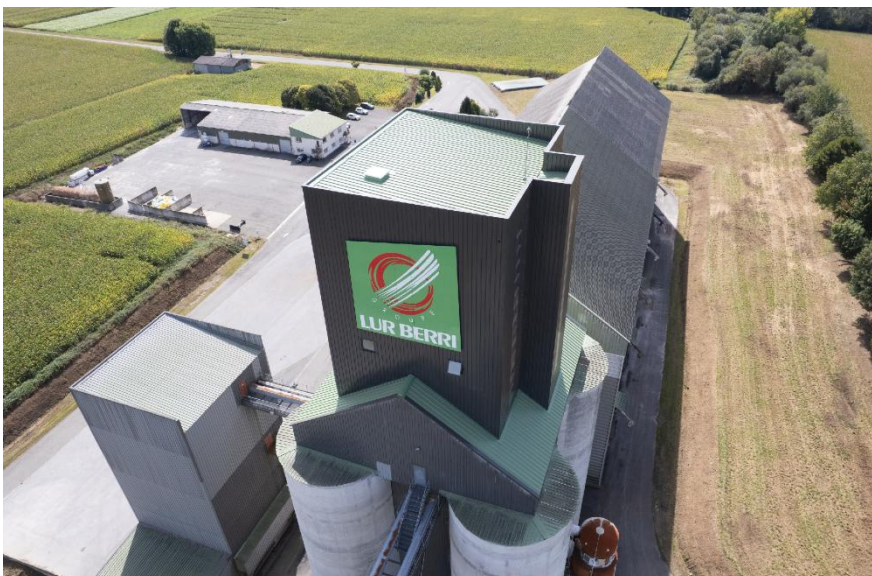
Site de collecte et de séchage d'Andoins