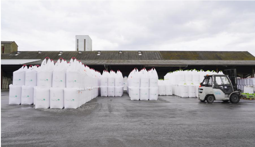
Usine d'engrais à Came

L'extension du site de Came est engagée, avec un programme d'investissements ambitieux s'élevant à 2,5 M€, destiné à doubler la capacité de production d'engrais, passant de 40 000 à 80 000 tonnes par an. L'objectif de cette usine d'engrais innovante est d'offrir des formules adaptées telle que la gamme de fertilisants modulaires Ferti'Lur et des services différenciants pour ses clients.