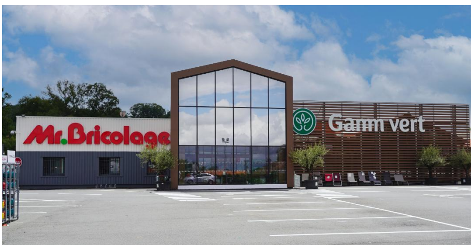
Magasin bicéphale Gamm Vert & Mr.Bricolage à Cambo-les-Bains

En combinant croissance externe, investissements ciblés et ancrage territorial, le Pôle Distribution ouvre de nouvelles perspectives de performance et de réussite partagée pour la coopérative et ses agriculteurs coopérateurs.