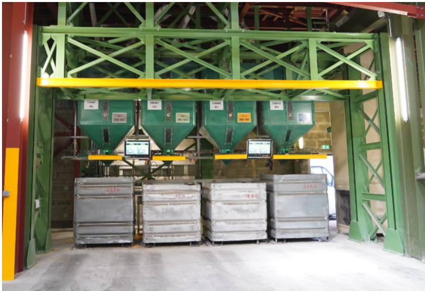
Calibreuse usine de semences à Aïcirits

Pour garantir la performance industrielle et répondre aux besoins de notre partenaire Corteva Agriscience et de notre marque LBS Seeds : 2,6 M€ ont été investis dans l'usine de semences de maïs à Aïcirits pour moderniser les outils de tri, de traitement et d'ensachage. Ces récents investissements ont permis de livrer les semences aux clients dans les délais impartis, malgré une récolte prolongée par la météo et coûteuse en raison du prix de l'énergie.