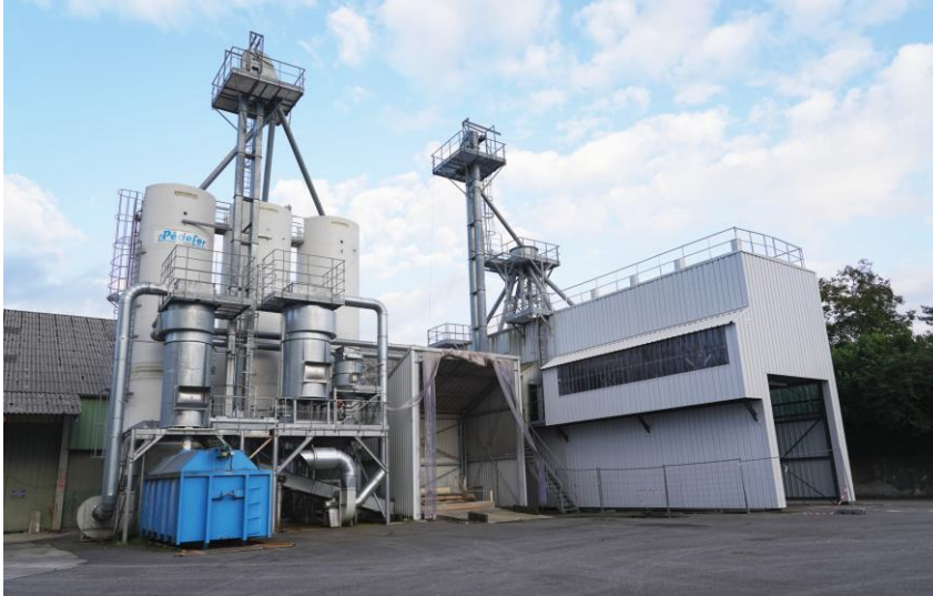
Usine de nutrition animale Pédefer à Coarraze